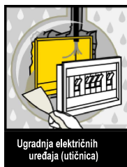
Ugradnja električnih uređaja (utičnica)