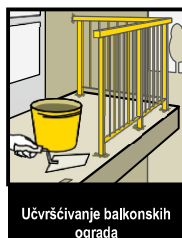
Učvršćivanje balkonskih ograda