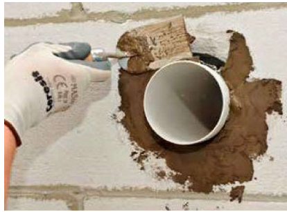
Postavljanje s Ceresit CX 5 Express reparaturnim mortom (prethodno navlažena podloga)