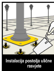
Instalacija postolja ulične rasvjete