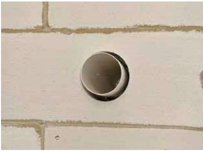
Postavite element koji želite fiksirati u ispravan položaj