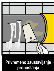
Privremeno zaustavljanje propuštanja