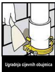
Ugradnja cijevnih objumica